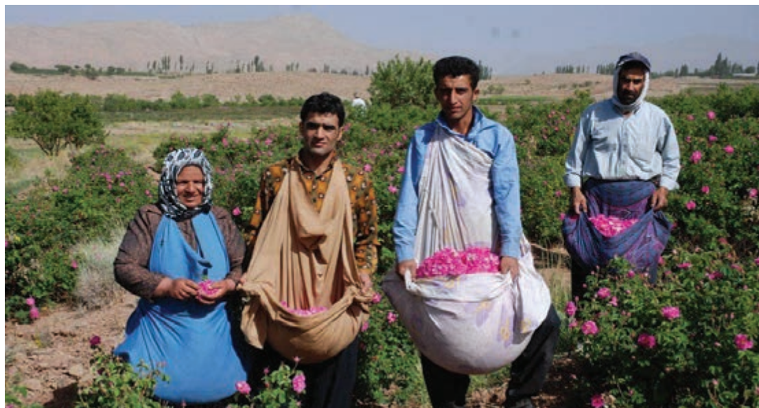
برداشت گل برای گلاب‌گیری