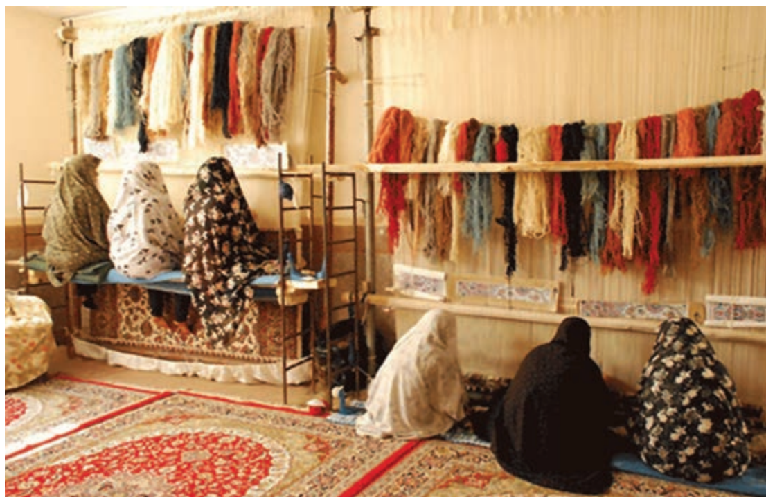
کارگاه فرش بافی (اشتغال و تولید)