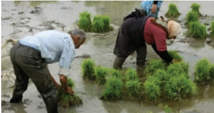
کار در شالیزار

به نظر شما آیا می‌توان ساعت کاری کارگران برای یک‌ماه را به روش دیگری نیز محاسبه نمود؟ با دوستان خود در این مورد بحث کنید.